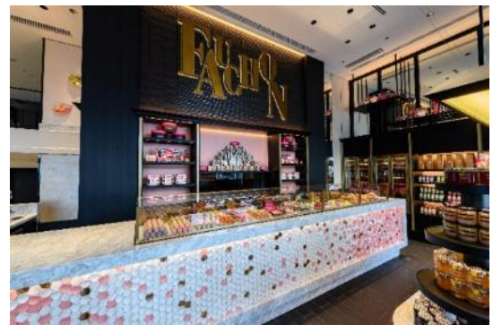
「Pâtisserie Boutique Fauchon」/店内