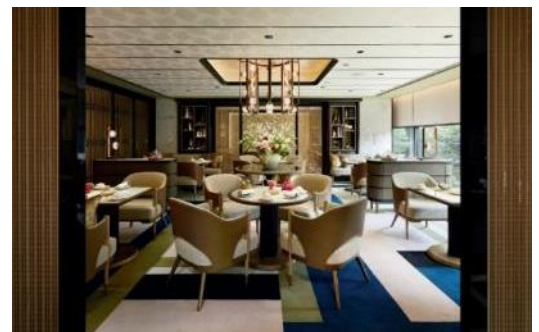
「Salon de Thé Fauchon」 / 店内