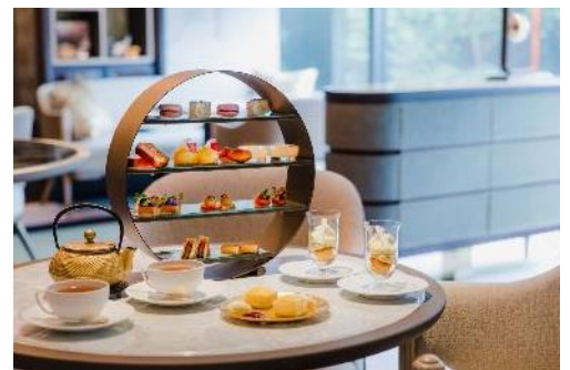
アフタヌーンティーセット (イメージ)